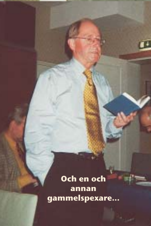
Och en och annan gammelspexare...