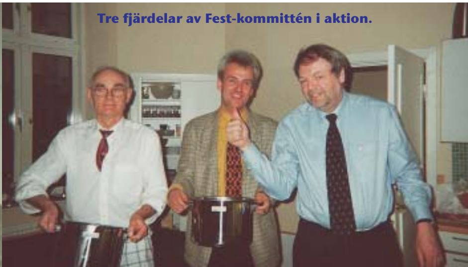
Tre fjärdelar av Fest-kommittén i aktion.