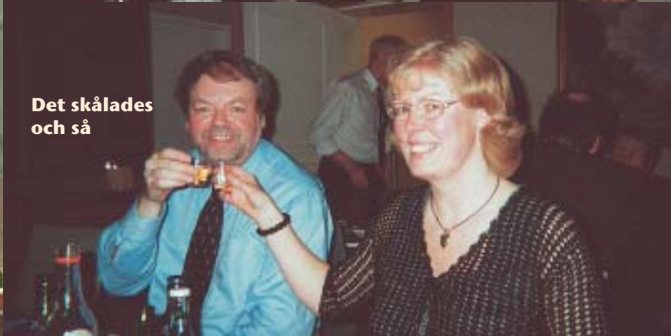
Det skålades och så