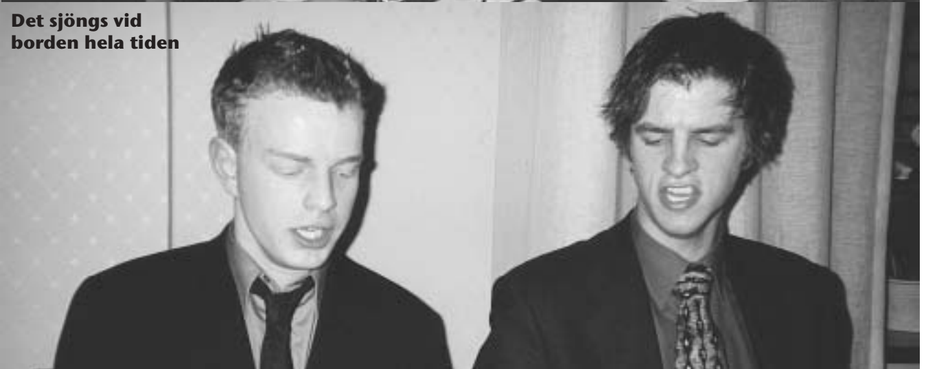
Och ännu mera folk...