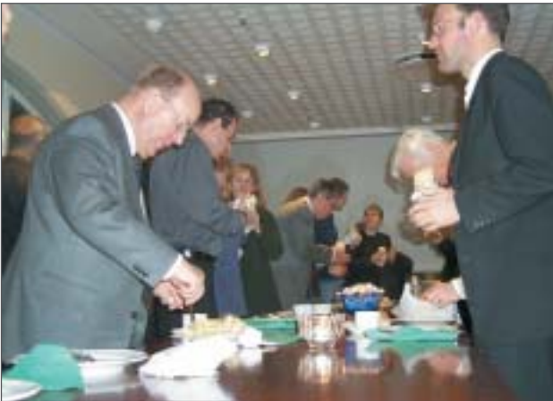
Visst var det en tid sedan man var i Handelspuben – man takterna sitter i.