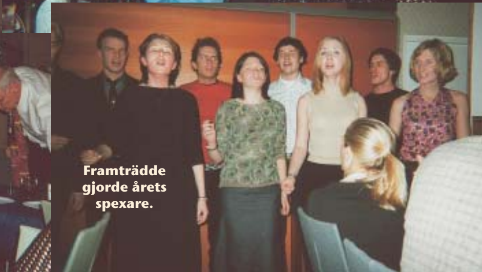
Framträdde gjorde årets spexare.