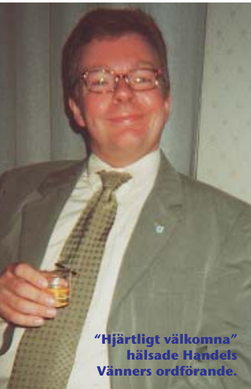
"Hjärtligt välkomna" hälsade Handels Vänners ordförande.