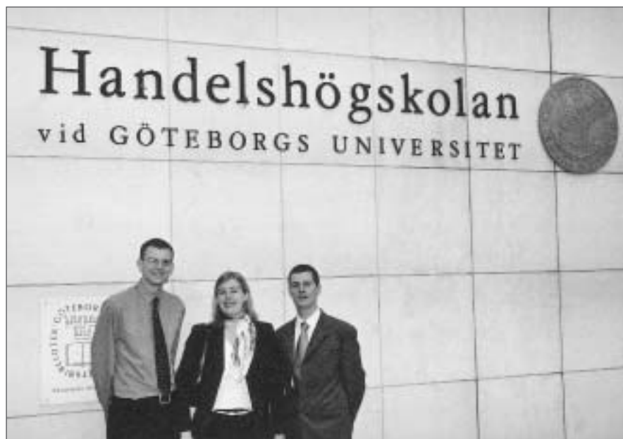
“Björnligans” medlemmar är studenter aktiva i HandelsConsulting och Handels högskolans i Göteborg Studentkår.

Sedan våren 2000 har företag i Göteborg den unika möjligheten att få in yngre kompetens i form av studenter i sina styrelser. Projektet, som går under arbetsnamnet Adjungerad styrelsetrainee , började på prov under fjolåret och kommer att utvecklas fullt ut under hösten 2001.