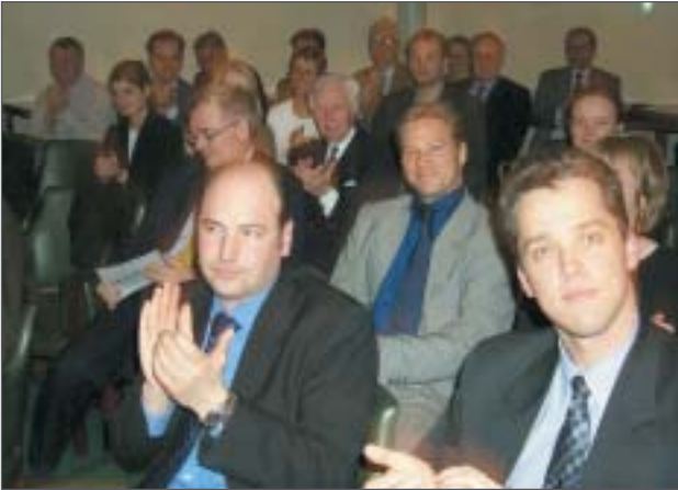
Såväl föreläsare som fotograf var intressanta.